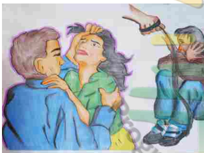
Algunos trabajos ganadores