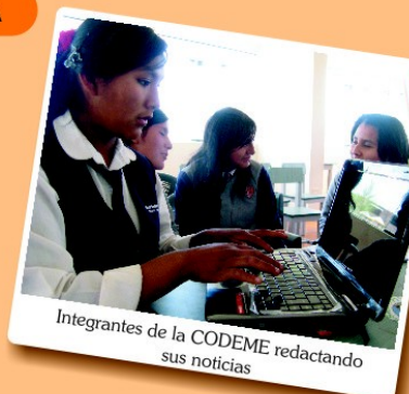
Integrantes de la CODEME redactando sus noticias